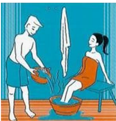
WARM VOETENBAD WARMES FUSSBAD WARM FOOT BATH BAIN DE PIEDS CHAUD