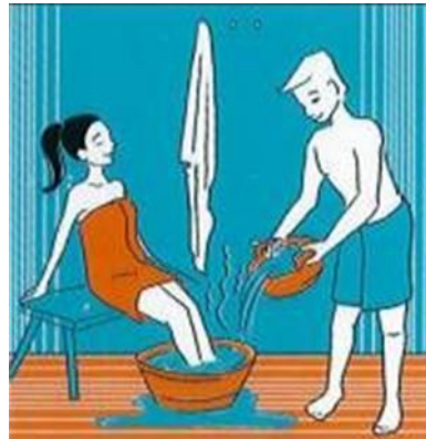
WARM VOETENBAD WARMES FUSSBAD WARM FOOT BATH BAIN DE PIEDS CHAUD