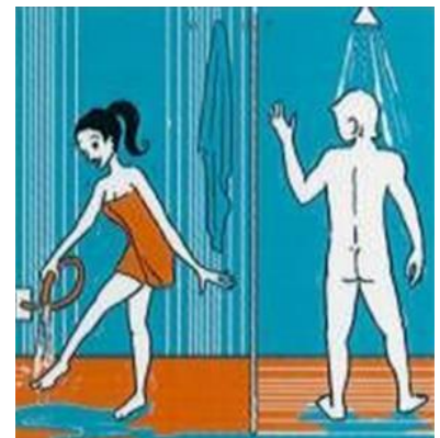
KOUDE DOUCHE KALTE DUSCHE COLD SHOWER DOUCHE FROIDE