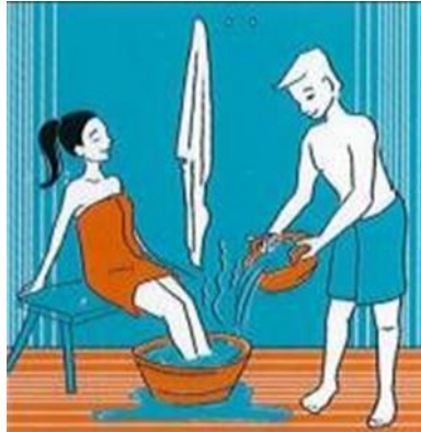
WARM VOETENBAD WARMES FUSSBAD WARM FOOT BATH BAIN DE PIEDS CHAUD