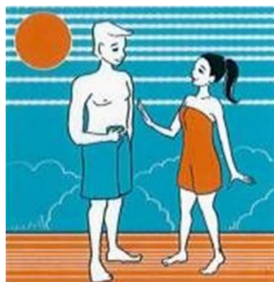
FRISCHE LUFT FRISCHE LUFT FRESH AIR AIR FRAIS