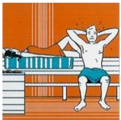
2 e & 3 e SAUNAGANG 2. & 3. SAUNAGANG 2 nd & 3 rd SAUNA SESSION 2 me & 3 me SEANCE DE SAUNA