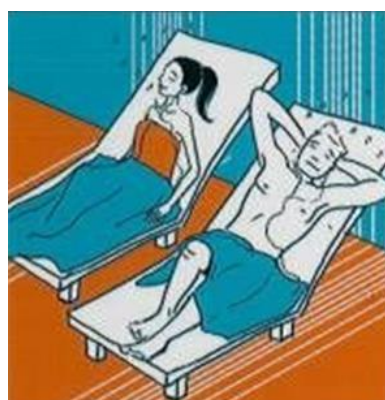
RUSTEN RUHEN REST REPOSER