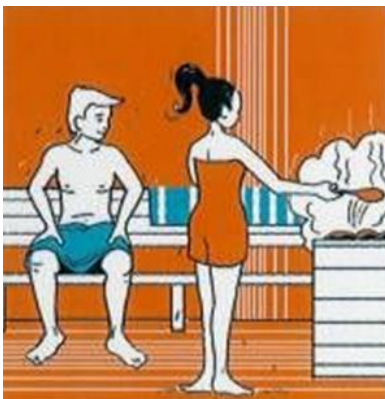
OPGIETEN AUFGUSS POURING WATER VERSER L'EAU