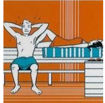
EERSTE SAUNAGANG 10-15 MIN. ERSTE SAUNAGANG 10-15 MIN. 1 st SAUNA SESSION 10-15 MIN. 1 re SEANCE DE SAUNA 10-15 MIN.