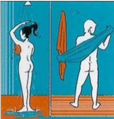
WASSEN EN AFDROGEN REINIGEN & ABTROCKNEN CLEAN AND DRY LAVER ET ESSUYER